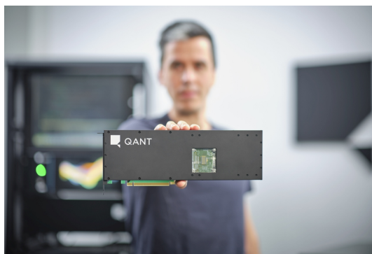
Q.ANT Native Processing Unit NPU-2

Diese und weitere Bilder stehen zum Download hier .