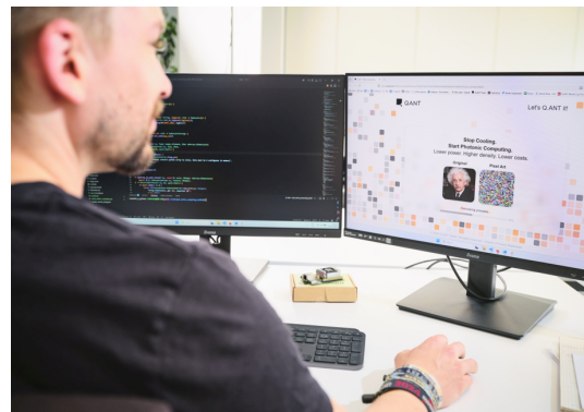
Q.ANT Working on the Diffusion Model